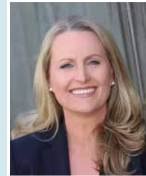
Moderatorin NDR Schleswig-Holstein Magazin

„Ich liebe es, für meine Familie und Freunde zu kochen und dann mit möglichst vielen am Tisch zu sitzen, zu reden, zu lachen und gut zu essen. Und egal, ob deutsch, italienisch oder asiatisch – alle Zutaten dafür bekomme ich frisch und in erstklassiger Qualität auf dem Neustädter Wochenmarkt.“